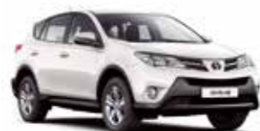
070 Білий перламутр**